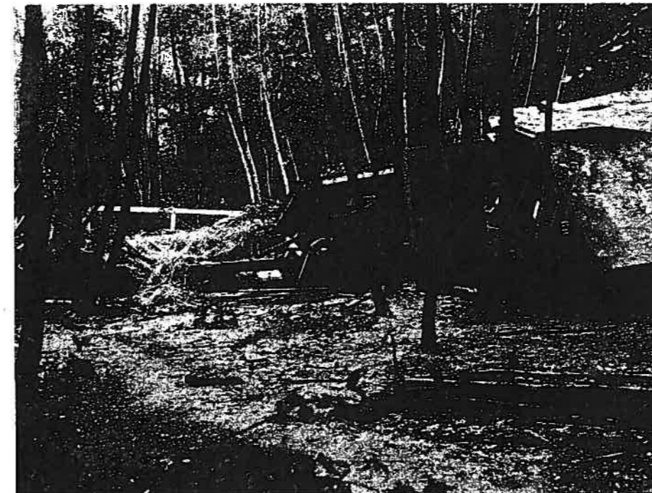
Aufnahme von der Unfallstelle in nördlicher Richtung.

men und weitergegeben worden. Überwachung und Einlagerung der Minen war Sache der jeweiligen Kompanie.