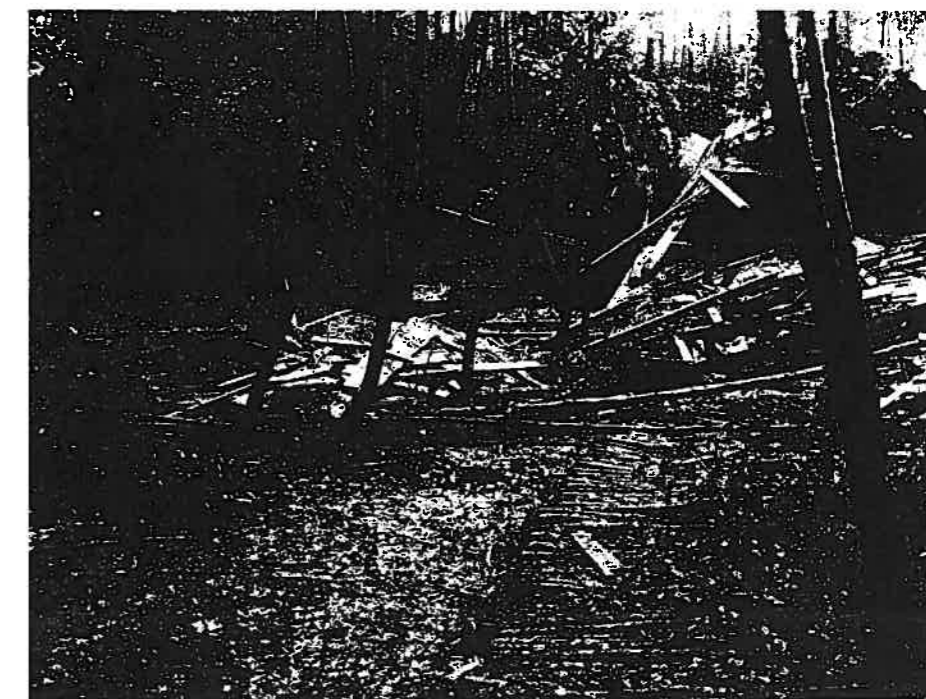
Aufnahme von der Unfallstelle in westlicher Richtung.

Nach Würdigung aller vorliegenden Punkte und vor allem der Tatsache, dass eine genaue Rekonstruktion des Unfallhergangs nicht mehr möglich war, befand das Militärgericht der 6. Division alle Angeklagten als nichtschuldig. Sie wurden freigesprochen. □